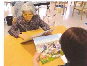
ミッケルアート回想療法