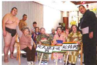
立浪部屋来苑・ちゃんこ鍋披露