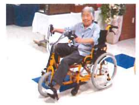
マシンでリハビリ