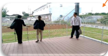
開放感あふれる広いテラス