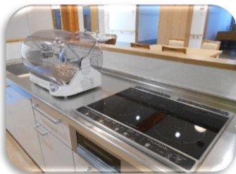
キッチンスペース

自然の豊かな周囲の環境に配慮した、木造平屋のユニット型特別養護老人ホームです。ヒノキを一部使用した家具、太陽光が入る明るい室内は、ご利用者様が快適で穏やかに暮らせる空間となりました。また、地域交流スペース・カフェも設けており、近隣地域の皆様の交流の場としてもお気軽にご利用いただけます。デイサービス・ショートステイ・居宅介護支援事業所も併設しておりますので、介護にお困りのご家族様のご相談も随時受け付けます。