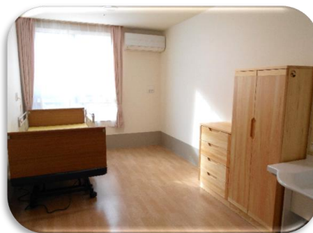
プライバシーを守る個室