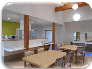
共同生活室・ホール